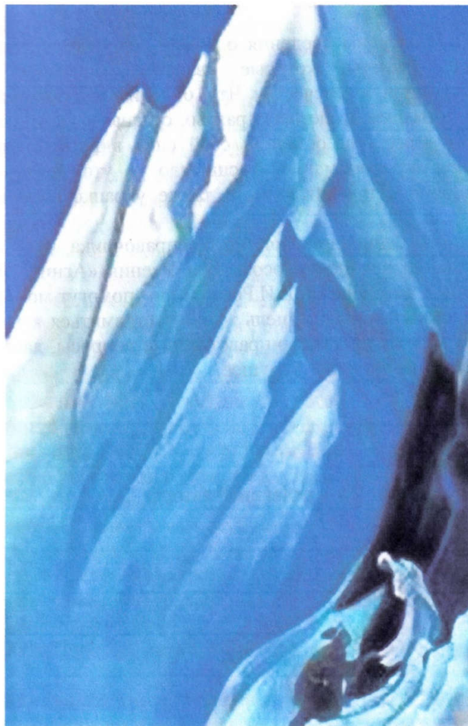
Ведущая. Картина Николая Рериха